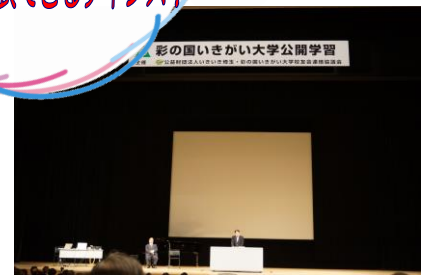
発表の様子 毎年、2団体に発表いただき、大好評!

公益財団法人いきいき埼玉では、 いきがい大学第1回公開学習において、活動の事例発表会を行います。 いきがい大学校友会で活動をされているみなさん、 日ごろ、いきいきと活動している様子を大ホールで発表してみませんか?